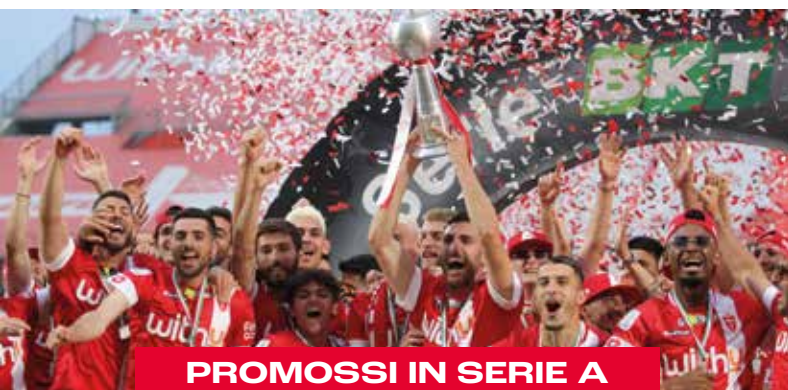
PROMOSSI IN SERIE A