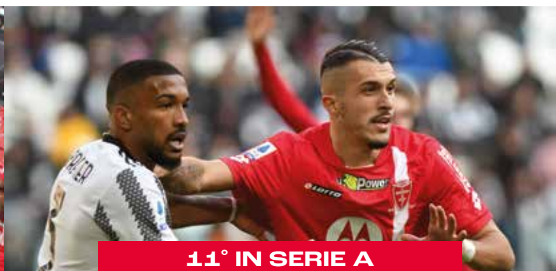
11° IN SERIE A