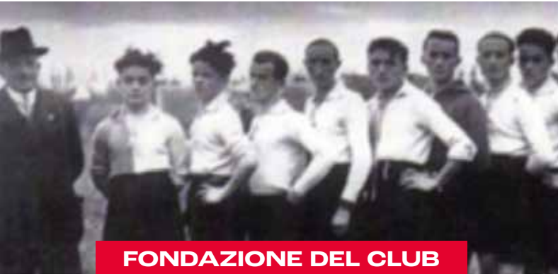
FONDAZIONE DEL CLUB