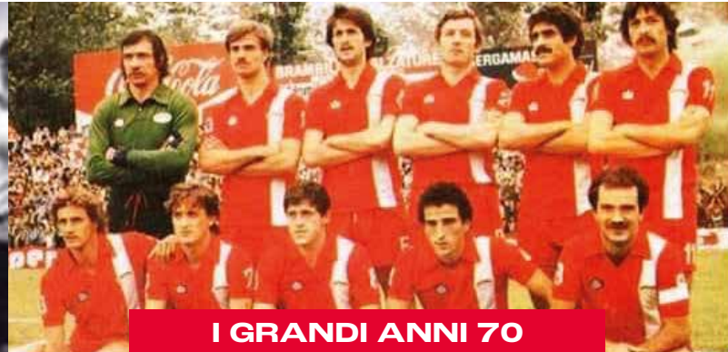
I GRANDI ANNI 70