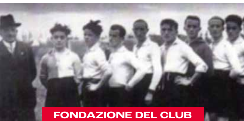
FONDAZIONE DEL CLUB