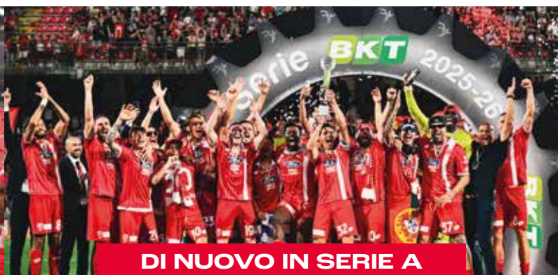
DI NUOVO IN SERIE A